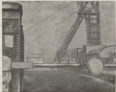
Esaki ta un bista di un di e mineran, cu a keda completamente paralisá y completamente bandoná door di e welga di e mineran frances.

Of mehor bisi, awor e dificultadnan ta cuminsa pa general De Gaulle, kende den prome instancia a wordo considerá como salvador de la patria pero ya ta pensando e aurolo ey.